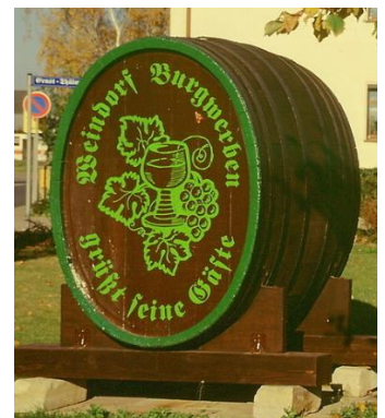
Bestehende Ortseingangsgestaltung Burgwerben

Das Willkommensschild steht an der Kreuzung „Burgwerbener Straße“ – „An den Weinbergen“, im OT Burgwerben und soll alle Gäste herzlich grüßen und einladen.