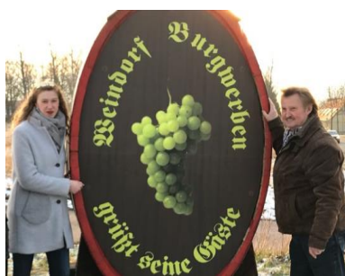
Neues Hinweisschild