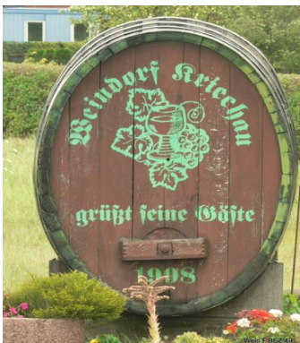
Bestehende Ortseingangsgestaltung Kriechau

Auch wir wollen unter dem Motto „25 Jahre – Straße der Romanik & Weinstraße Saale-Unstrut“ ein Zeichen setzen.