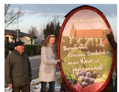
Neues Weinfass